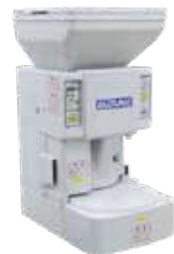
最新型寿司ロボットを全店に導入