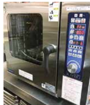
最新式スチームコンベクションオープン